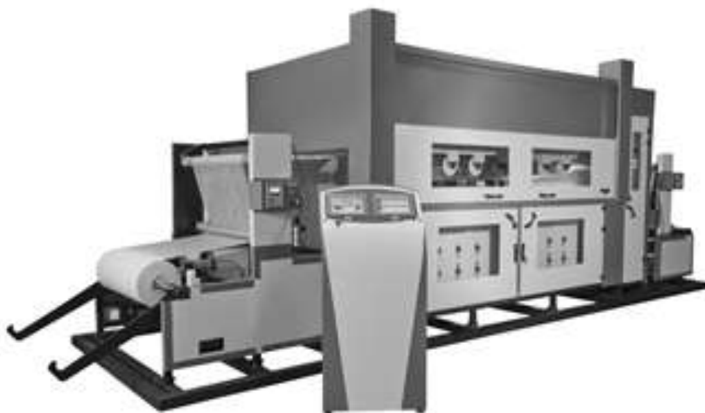
شکل ۳- دستگاه الکترورسی صنعتی

قابلیت تشکیل فیلم و خاصیت ضد میکروبی کیتوزان، موجب استفاده از این بیوپلیمر طبیعی در صنایع بسته‌بندی مواد غذایی شده است و می‌توان نانوالیاف آن را با استفاده از روش الکترورسی تولید نمود [۲۸، ۲۹].