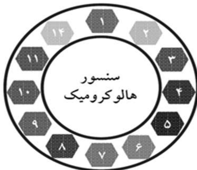
شکل ۴- سنسور هالوکرومیک

نتایج مطالعه دیگری نشان داد که سنسورهای تولیدی بر پایه نانوالیاف الکترورسی شده سلولز با رنگدانه آنتوسیانین ۲ استخراج شده از کلم قرمز، توانایی تشخیص مقادیر pH را در دامنه بین ۱ تا ۱۴ دارند (شکل ۴) [۵۳].