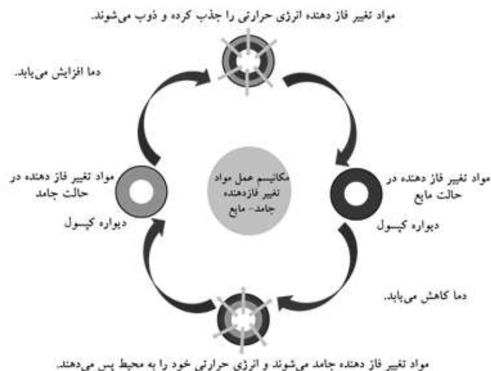
شکل ۱- عملکرد مواد تغییر فاز دهنده جامد-مایع

نانوالیاف کربن یا فیلترهای الیاف و ... تقویت می‌شود. نانوالیاف کربن در برابر خوردگی شیمیایی مقاومت بالایی داشته و با اغلب مواد تغییر فازدهنده سازگار هستند [۲۰]. همچنین هدایت حرارتی این الیاف به طور قابل توجهی بالا بوده و چگالی آن‌ها کمتر از فلزاتی است که معمولاً به عنوان افزودنی استفاده می‌شوند [۲۱].