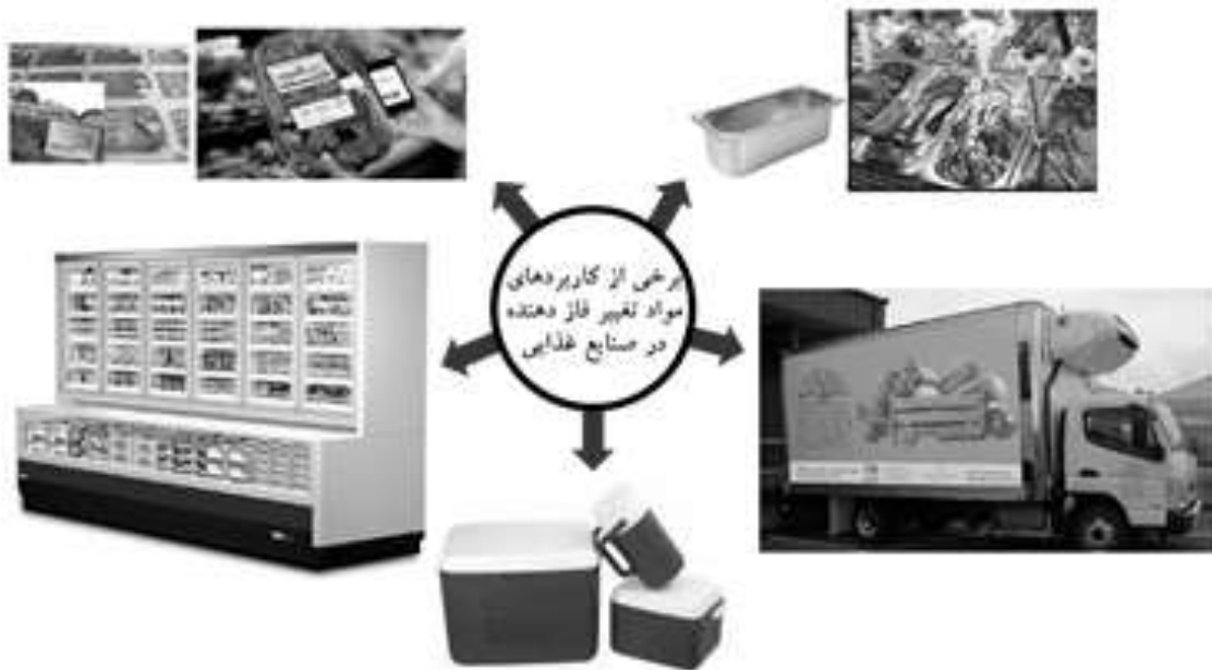
شکل ۲- کاربرد مواد تغییر فازدهنده در صنایع غذایی

جدیدی از ثبات ابعادی از طریق الکتروسیسی ۲ ماده تغییر فازدهنده و کامپوزیت پلیمر انجام شده است [۲۳]. مواد تغییر فاز دهنده دارای پتانسیل‌های کاربردی زیادی در زمینه کنترل حرارتی ۳ و ذخیره‌سازی انرژی حرارتی ۴ که تفاوت اصلی در این دو زمینه مربوط به ضریب هدایت حرارتی ماده تغییر فازدهنده است. در برخی از کاربردهای این مواد در زمینه کنترل حرارتی، بهتر است از مواد تغییر فازدهنده‌ای با ضریب هدایت حرارتی پایین استفاده شود. این در حالی است که استفاده از مواد تغییر فازدهنده با ضریب هدایت حرارتی پایین، یک مشکل اساسی در سامانه‌های ذخیره‌سازی انرژی حرارتی محسوب می‌شوند [۴].