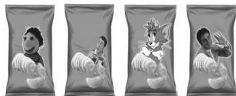
شکل ۵- تصاویر کارتونی و غیر کارتونی

سطح معناداری کوچک‌تر از ۵ درصد است، بنابراین فرض H 1 پذیرفته می‌شود. به عبارت دیگر، بسته‌بندی‌هایی که در آن‌ها از رنگ‌های گرم و شاد استفاده شده از نظر کودکان جذاب‌تر است.