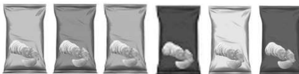
شکل ۳- بسته‌بندی رنگ‌های سرد

همان‌طور که در (جدول ۲) مشاهده می‌شود، چون پذیرفته می‌شود. به عبارت دیگر، بسته‌بندی‌هایی که در