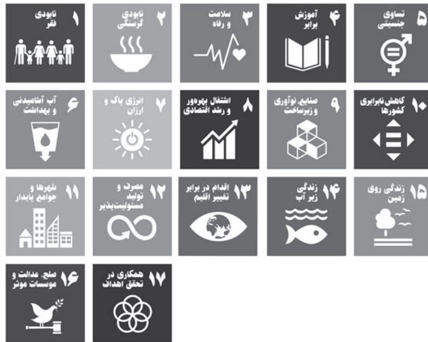
شکل ۱- هدف‌های توسعه پایدار (منبع: [۱])، به ترجمه و ویرایش نگارنده

آن چالش‌ها و فرصت‌ها به صورت دقیق‌تر در هر یک از شاخص‌های بسته‌بندی پایدار مطرح می‌شود (شکل ۱). (ج) کچی (سیستان و بلوچستان) / زُمبيله (فارس): سبد حصیری بزرگ بافته شده از برگ درخت نخل همراه با دو دسته که از آن برای حمل اشیاء استفاده می‌کنند [۵]؛