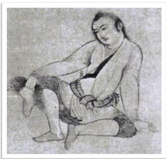
شکل (۱): جوان با پای‌پوش گیوه، احتمالاً رضا عباسی، مکتب اصفهان،

گیوه نوعی کفش یا پاپوش سنتی است که تولید و استفاده از آن در استان فارس رواج داشته و باوجود منسوخ شدن در برخی مناطق هنوز هم عده‌ای مشتری پر و پاقرص و تعدادی به تولید آن مشغول هستند. صادرات گیوه از ایران به‌گونه‌ای است که برخی آمارها از صادرات چندین میلیون دلاری و مشتریان پر و پاقرص در خارج از کشور حکایت می‌دهد. حتی در برخی استان‌ها مانند کردستان و کرمانشاه گیوه در صدر صادرات صنایع‌دستی قرار دارد. گیوه‌بافی یکی از جالب‌ترین و ارزنده‌ترین صنایع‌دستی روستایی ایران محسوب می‌شود. پیشینه این صنعت به حدود ۱۰۰۰ سال پیش بازمی‌گردد که در شکل (۱ و ۲) نمایش داده شده است [۱].