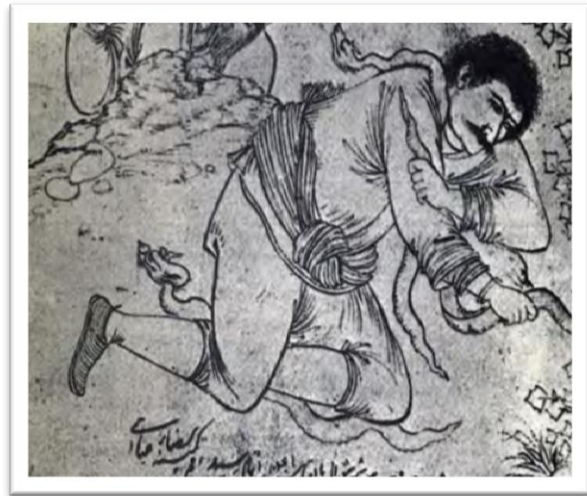
شکل (۲): مارگیر با پای‌پوش گیوه، رضا عباسی، مکتب اصفهان، ۱۰۱۰ ه.ق. مأخذ: خزایی ۲۷۳: ۱۳۶۸

هدف از این پژوهش بررسی نقش بسته‌بندی در ترغیب مصرف‌کنندگان به خرید گیوه فارس است. طبق مطالعات و بررسی‌های انجام‌شده در این پژوهش، باوجود چهار ویژگی که به آن اشاره شد و در نتایج تحقیق جزئی از متغیرها و پرسشنامه