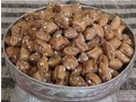
شکل (۱): آب‌نبات چیکو [۲۳].

باتوجه به ارزش غذایی بالای آب‌پنیر، این محصول در مقایسه با تنقلات موجود در بازار، کمترین مضرات را دارد. همچنین، افزودن مغزهای خوراکی گردو، پسته و کنجد که هر کدام دارای خواص تغذیه‌ای ارزشمندی هستند، این محصول را متمایز می‌سازد. از سوی دیگر چیکو از نظر ترکیبات، نزدیک به ترکیبات شیر ولی از نظر ساختار و بافت مشابه آب‌نبات است [۲۳].